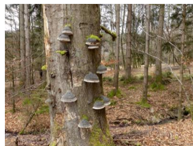
Fig. 12-4 Volumes de bois mort à l'hectare en forêt wallonne* (2012)

Alors que rien ne semble vivre sur du bois mort, le bois mort (au sol ou sur pied) constitue pourtant un habitat pour de nombreuses espèces forestières. Ainsi, la survie de près d'un quart de ces espèces (coléoptères, lichens, champignons...) est étroitement liée à la présence de bois mort. Celui-ci relève donc d'une importance majeure pour le maintien de la biodiversité. Pour assumer ce rôle écologique, on estime que le volume minimal de bois mort doit être approximativement de 30 m 3 /ha. En Wallonie, tous peuplements confondus, on en compte en moyenne 10,7 m 3 /ha (graphique ci-joint).